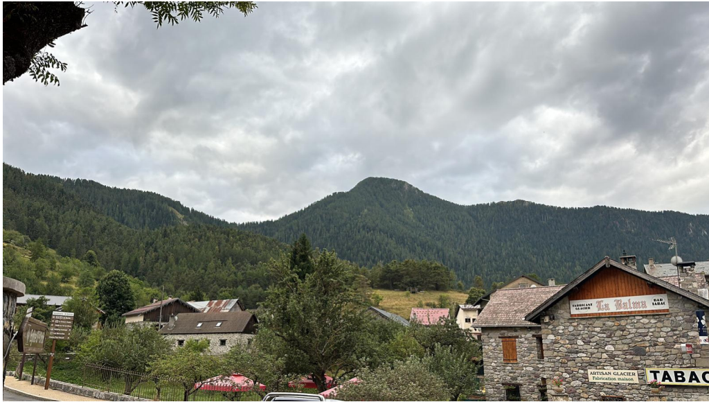
La Balma et le Bois Noir