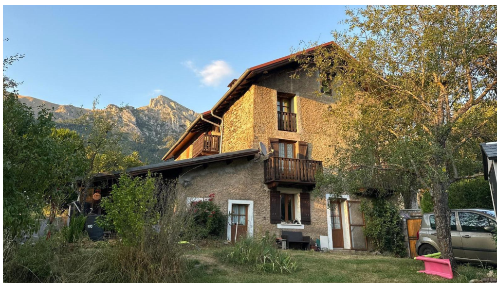
La maison de Cathy

Au choix, après s'être retrouvé place de l'église, et chez Cathy autour d'un café.